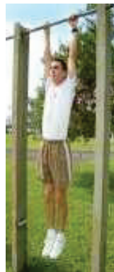
Posição Final (3)

1.1.2 Os cotovelos devem estar em extensão total para o início do movimento de flexão.