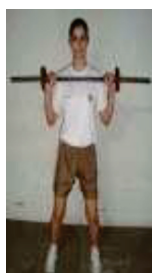
Posição Inicial (1)

a) posição inicial: de pé, pernas afastadas, barras suspensas até a altura dos ombros, com pegada na posição de rosca inversa, e abertura lateral no alinhamento dos ombros. (1); e b) execução: estender totalmente e simultaneamente os braços para cima. (2); voltar à posição inicial (1) pela flexão completa dos braços. (3); realizar, nessas condições, o maior número de extensão e flexão de braços, até o limite da resistência do candidato, sem executar movimentos de flexão de pernas ou qualquer outro movimento que impulse para cima os halteres, além dos braços. O repouso é permitido, na posição (1), devendo o candidato ser avisado a respeito. A barra deverá pesar 6 kg, ter 1,20m de comprimento e até 25mm de espessura, compondo, o conjunto de duas anilhas de 2 kg cada, totalizando 10 kg. O comando para iniciar a prova será dado pelo avaliador.