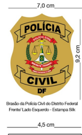
Brasão da Polícia Civil do Distrito Federal Frente/Lado Esquerdo - Estampa Silk